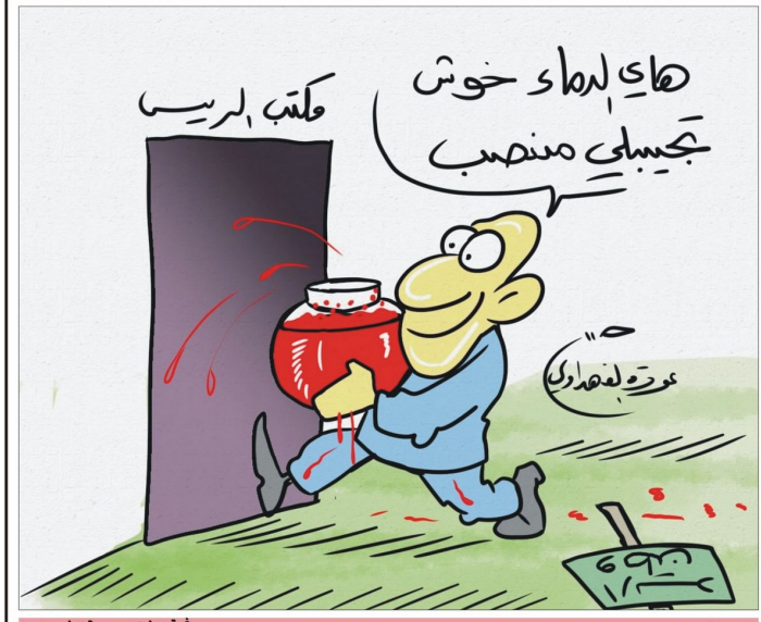
بريشة الشان عودة الفهداوي كاركاتير