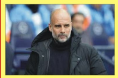
جوارديولا : لن أحكم على سيلفا

مقابلة-المستور الرياضي وجه الإسباني بيب جوارديولا، مدرب مانشستر سيتي، كلمات الإساءة إلى فريق ليفربول ومدربه الألماني يورجن كلوب، وقسلاً جوارديولا، في تصريحات أبرزها الصحفي فابريزيو رومانو، خبير الميركاتو: "محبج فريق ليفربول، مهما حدث لهم في هذا الموسم، سأظل معجباً بهم". وأضاف المدرب الإسباني، بحسب ما نقله فابريزيو عبر شبكة "أكس": "عندما قلت أن يورجن كلوب ليفربول كانوا دائما المنافس الحقيقي.. أنا أفقد أنهم الفريق الذي كنا ننافسه وقف أمامنا وجهاً لوجه.. لأن كان منافساً لمدة ٦ أو ٧ سنوات". وجاء ذلك بعد أن خسر ليفربول صدارة البريميرليج، بالإضافة إلى خروجه من ربع نهائي الدوري الأوروبي هذا الموسم واختتم: "كل شيء على ما يرام مع برنادو سيلفا.. لقد أهدر ركلة ترجيح، لكنه لم يكن يرغب في حدوث ذلك، هذا الأمر يحدث، لكن عندما يحدث ذلك تكون هناك مسؤولية على الجميع، لذلك الحكم أبدأ، سيكون لدي احترام كبير".