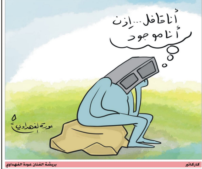
بريشة الفنان عودة الفهداوي