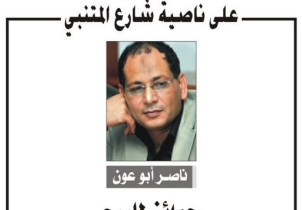
على ناصبة شارع المنبني