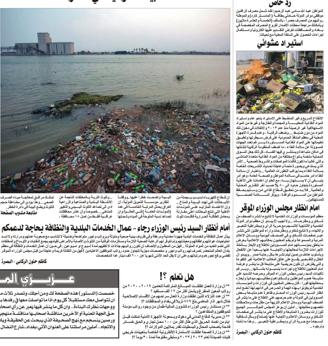
عبد الله بن علي كاتب عراقي