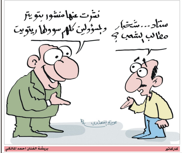
ببريشة الفنان احمد المالكي