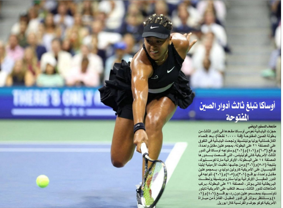
أوساكا تبليغ ثالث ادوار الصين المفتوحة

متابعات الدستور الرياض تلقى ايفان يوريتش، المدير الفني لروما، نيا سار بشأن نجمة الارجنطيني ساولو ديبالا كان قد اثار قلق فريقه بعدما اصيب خلال مواجهة الخسيس ضد اتونيك بوليسا بالدوري الاوربي، خرج على ارضاها بين التوتيك، وبحسب صحيفة "المانياتا ميلو سيور" الالمانية، فان ديبالا خضع لفحوصات طبية والتي بدت المخاوف بشأن اصابته النجم الارجنطيني. ووضحت ان ديبالا صاحب ٣٠ عاما يعاني فقط من بعض التعب في ساقيه، لافتة الى انه لا يتوقع غيابيه عن الملاعب، وتابعت انه بالرغم من ان يوريتش قد يمنح ديبالا راحة قبل مباراة الاحد ضد فينيسيا، الا انه قد يدخل لقائمة الفريق ويشارك كلاعب بسديل فقط وتعامل روما مع ضيفه بوليسا، بهدف لكل فريق، في الميراة التي اقيمت بمعلم الاولمبيكو، بالجولة الاولى من الدوري وبالبج.