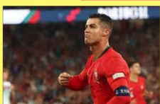
رونالدو يبدأ العد التنازلي

السعودية-سبيريدر بدأ كريستيانو رونالدو قائد النصر، العد التنازلي لتحقيق إنجاز تاريخي مع "العالمي"، وذلك بعدما سجل هدفا في الفوز على الوحدة، الجمعة، بهدفين دون رد، ضمن الجولة الخامسة من الدوري السعودي. وتمكن الدون من هز شبك الوحدة في الدقيقة ٥٦ عبر ركلة جزاء نفذها ببراعة، البرقع رصيده التي ٤ أهداف في رحلة الحفاظ على الحذاء الذهبي الذي توج به الموسم الماضي. ووصل رونالدو إلى هدفه رقم ٧٠ في مختلف المسابقات منذ وصوله إلى الملاعب السعودية في يناير ٢٠٢٣، ثاب ٢٠٢٣، عقب فسخ عقده مع مانشستر يونايتد. وبالنظر إلى تاريخ رونالدو وقدراته التهديفية، نجد أنه بات قريبا من الوصول إلى ١٠٠ هدف بقميص النصر في مختلف المسابقات، خاصة وأن "العالمي" لديه العديد من المباريات والتحديات خلال الفترة المقبلة. الموسم الماضي كان خير دليل على توجح الدون التهديفي، إذ تمكن من تسجيله في النصر، حيث سجل ٥٠ هدفاً وصنع ١٣ آخرين في ٤٥ مباراة خاضها مع النصر، وهو ما يؤكد قدرته على الوصول للرقم التاريخي رقة "مئتين هدف".