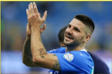
مبارك وهشيم يحصد جائزة لاعب الشهر

السعودية-توي محمد توج الصويدي ألكسندر ميتروفيتش، مهاجم الهلال، بجائزة أفضل لاعب في الدوري السعودي عن شهر سبتمبر/أيلول الماضي، ونجح ميتروفيتش خلال الشهر الماضي في تسجيل ٧ أهداف، تصدر بها قائمة هدافي دوري روشن للمحترفين عبر الجولات من الأولى إلى الخامسة وأعلن الحساب الرسمي للدوري عبر "تس" عن حصول ميتروفيتش على الجائزة، بينما كان مدربه البرتغالي جوجي جيسوس قد حصد جائزة مدرب الشهر أيضاً وكان ميتروفيتش قد وصل ل ٨ أهداف قبل أن تعلن رابطة دوري السعودي عن تقليص عدد أهداف المهاجم الصربي إلى ٧ بعد احتساب أحد هدفيه في مرعى الرياض بمباراة الجولة الثالثة من البطولة لصالح بوان باريسيت مدافع المنطق في مرماه بطريق الخطأ وكان ميتروفيتش قد أنهى الموسم الماضي محققاً المركز الثاني في قائمة هدافي الموسم خلف البرتغالي كريستيانو رونالدو الذي حصد لقب الهدف.