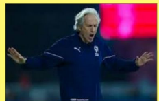
أزمة تورق جيسوس في الهلال

السعودية-سبير بنر رغم المستوى المذهل للهلال خلال منافسات الموسم الجاري، إلا أنه يعاني بشدة من أزمة واضحة متمثلة في استقبال الأهداف بشكل مستمر ويصدر الهلال جدول ترتيب دوري المحترفين برصيد ١٨ نقطة، بعدما حقق العلامة الكاملة في ٦ مباريات، وعلى مستوى دوري أبطال آسيا للتحفة، حقق "الزعيم" الفوز في أول مباراتين على الريان القطري (١-٣) والشهرة العراقي (٥-٠)، فيما تأهل ثمن نهائي كأس خادم الحرمين الشريفين، بالانصراف على الكعبية، بهدف دون رد، وبدا الهلال الموسم بتحقيق السوبر السعودي، بالفوز على الأهلي بركلات الترجيح (١-٤) بسعد التعادل (١-١) في نصف النهائي، قبل أن يحسم اللقب أمام النصر بنتيجة (٤-١) لكن رغم ذلك، عانى الهلال بشكل واضح من استقبال الأهداف بصورة مستمرة على عكس الموسم الماضي الذي شهد ظهور مميز من الحارس المغربي ياسين بونو بجانب الخط الخلفي.