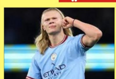
هالاند يحصد جائزة جديدة

متابعة- الدستور الرياضي حقق النرويجي إيرلينج هالاند، نجم مانشستر سيتي، جائزة جديدة في الموسم الجاري، وكشف الحساب الرسمي لمانشستر سيتي، عبر منصة "تويتر"، عن فوز هالاند بجائزة أفضل لاعب في الفريق، عن شهر سبتمبر/ أيلول الماضي، ووفقاً لموقع مانشستر سيتي الرسمي، فإن هذا الشهر يعد الثاني على التوالي الذي يحصل فيه هالاند جائزة أفضل، في موسم ٢٠٢٤/٢٥، وبدا هالاند شهر سبتمبر/ أيلول بتسجيل هدفين في الفوز ١-٢ على برينتفورد، كما افتتح التسجيل في التعادل ٢-٢ مع أرسنال، وواصل وقتها بتسجيل عام إلى ١٠٠ هدف مع مانشستر سيتي في ١٥ مباريات.