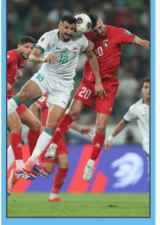
السورة الاولى الاسود يهاجعة نفاك الشركة

اكثر من ابي السكوة قلعة الاطفال السكوت عنا