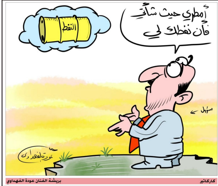
بريشة الفنان عودة الفهداوي