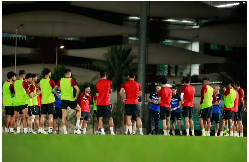
بغداد: المنتخب العراقي في مواجهة المنتخب الاردني...