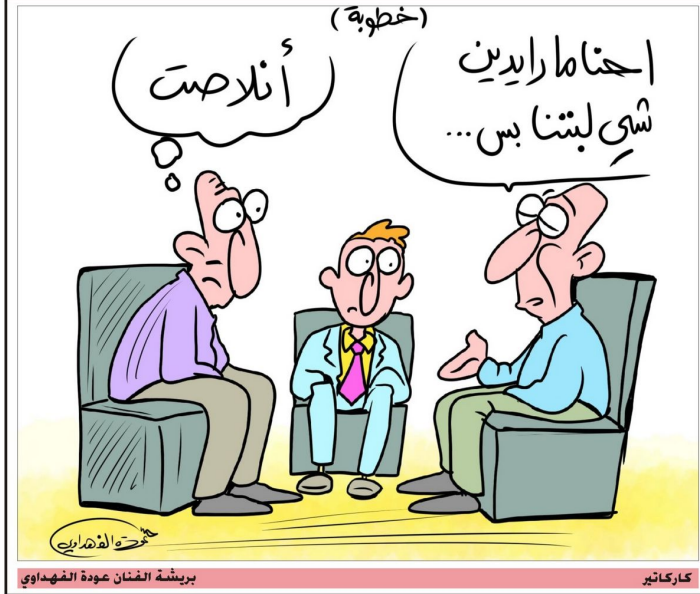
كارثير بريشة الفنان عودة الفهداوي

اتحاد الادباء في البصرة يناقش الموروث الشعبي والهجات البصرية المعروفة بغداد- الدستور قدمت الايبيبة نوال جويد محاضرة عن الهجات في البصرة ومواضيع اللغوية وتاريخية، ضمن النشاط الثقافي للمنتدى التراث الشعبي والمعروف والتراث الشعبي بالبحريرة وتحدثت جويد عن مواضيع ثقافية متنوعة لموروث الشعبي البصري وكجزء من تاريخ البلدان بل وكان هو الحضارة الحقيقية لأي مجموعة أو شعب، مدينة أو أشهر تلك الكلمات المتداولة في لهجاتنا البصرية وطريفات التي عرفتها الطيبة والنواضع واغتنم الايبيبة نوال جويد الموروث الشعبي البصري المعروف والتي فتحت ابواب امام اللهجة البصرية التي يتداولها أبناء المناطق في الاضحية والنواحي واغتنم الحضور الذي تسجد وتغال مع المحاضرة وسامها فخرنا بقاء تقنية ومدخلات وسعت فلق الموضوع. هجة البصرة وما اشهرت به ونيرت في الكلام التي امتازت بها العراقية الأخرى. وقالت نوال جويد في حديثها لـ "الدستور" إن البصريين، وهي واحدة من