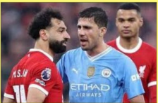
رودري : صلاح أصعب خصم

متابعة- الدستور الرياضي يعتقد نجم الاسباني رودري هيرنانديز، لاعب وسط مانشستر سيتي، ان اصعب خصم واجهه في إنجلترا هو الدولي المصري محمد صلاح. وضم رودري لصفوف مانشستر سيتي، قادما من لنتيكو مدريد، في صيف ٢٠١٩، وساهم في تحقيق جميع الالقاب الممكنة مع السيتيزنس، قبل ان يتوج هذا العام بجائزة الكرة الذهبية وقسلا رودري، في تصريحاته لإذاعة "كادينا كوبي" الاسبانية، حول اصعب خصم واجهه في مسيرته: "في السابق كان ليونيل ميسي عذما كنت لاعب في الدوري الاسباني". وأضاف: "حاليا محمد صلاح، خاصة في ملعب القلعة، فهو يهزم مثل السكين، ومواجهته صعبة للغاية". وخاض صلاح ٢١ مباراة ضد مانشستر سيتي بمختلف المسابقات، منذ ان انضم للبرشلونة في صيف ٢٠١٧، حيث سجل ١١ هدفا وصنع ٦.