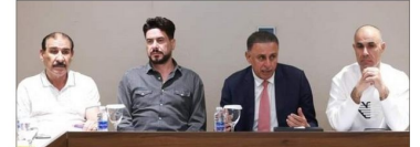
بغداد: المنتخب العراقي...