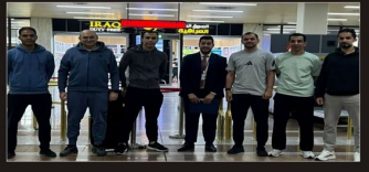
بغداد: المنتخب العراقي...