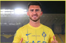
رد قاطع بشأن لابورت