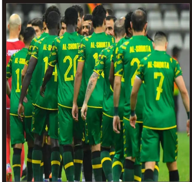
بغداد: المنتخب العراقي...