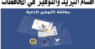
بغداد-الدستور تحت إشراف وزير الاتصالات وتكنولوجيا المعلومات، تم إطلاق خدمة بطاقة التوفير الإلكترونية في عدد من أقسام البريد والتوفير في المحافظات.