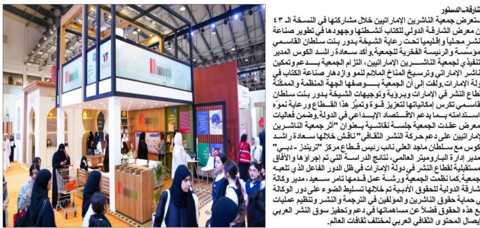
الشارقة- تستعرض جمعية الناشرين الإماراتيين خلال مشاركتها في النسخة الـ ٤٣...