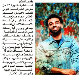
بغداد- استضيف في الدورة ٤٣ من معرض الشارقة الدولي للكتاب...