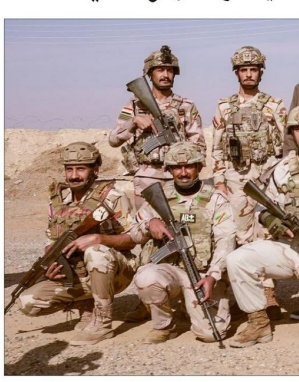
بغداد، ١٧ تشرين الثاني (الدستور) - أكد وزير الدفاع، على توخي الحيطة والحذر من الخلايا النائمة، وذلك من خلال تعزيز عمليات نيونى، وذلك بهدف تأمين الحدود، وضمان سلامة العمليات العسكرية.