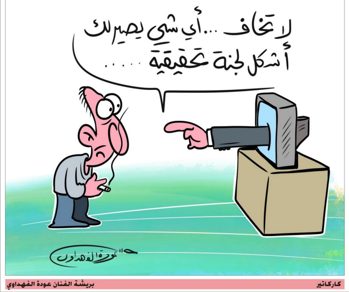
بريشة الفنان عودة الفهداوي

وفق هذا الاستشراف يبدو من الممكن القول: أولاً يمكن أن نتجج إلى تسويات دولية تطرح مع روسيا الاقتصادية والصين... أو الشيطان الروس من قبل أمير آسيا وتسويات تاريخية مع سفة الشرق الأوسط... بلحالات متناقصة تصل حد الحرب المباشرة أو بالوكالة... وبين نموذج اللعبة الصفوية التي تجعل كل طرف بمواجهة استحقاقات الربح والخسارة و حسم الصراع في بقعة الممتد من المهزوم و التسويات التي يمكن أن يطررها الرئيس ترامب مع بداية دخوله البيت الأبيض.