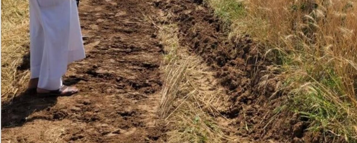
ناشد عدد من الفلاحين في قضاء الاحرار بمحافظة واسط المعين بوزارة الموارد المائية والزراعة

تضع منظمة بناتنا وبناتنا وبناتنا بين يديك وتتخلف مستقبليهم بين يديك وتتخلف مستقبليهم بينهم طلبة صف سابع مساعي أعوانا السنة الدراسية لغرض تحسين معدل ألافها كما تعرف بأن مستقبليهم يتوقف على المعدل وعند مر اجتهاداً لمدارسنا نواجهنا بوجود فرق من وزارة التربية يمنع طلبة والطالبات والمساعي من الإعادة لسنة ثانية بينما يسمح لطلبة الصعيحي من الإعادة ونحن لنعلم لماذا الفرق... وهذا يعني أن مستقبليهم الدعوات أو ربما الألف من الطالب والطالبات قد ذهب أدراج الرياح وسيتم حرمانهم من إكمال دراستهم والقبول في الكليات والجامعات وهذا أمر محزن ومزمن مستقبليهم أينما أذا انتشاكنا بأن ننظر لعطف لاهل الشباب وتحت مسؤول عنهم وعن مستقبلهم أمام الله وتعين النظر في هذا القرار الملغى الصلبر من الوزارة وتشملهم بعطف الأبوي وتصيح لهم ببلادهم السنة الثانية لئلا يمانعوا من الإعادة لسنة ثانية ثم لا يمانعوا من الإعادة لاربع ثم لا يمانعوا من الإعادة لخمس مرات..