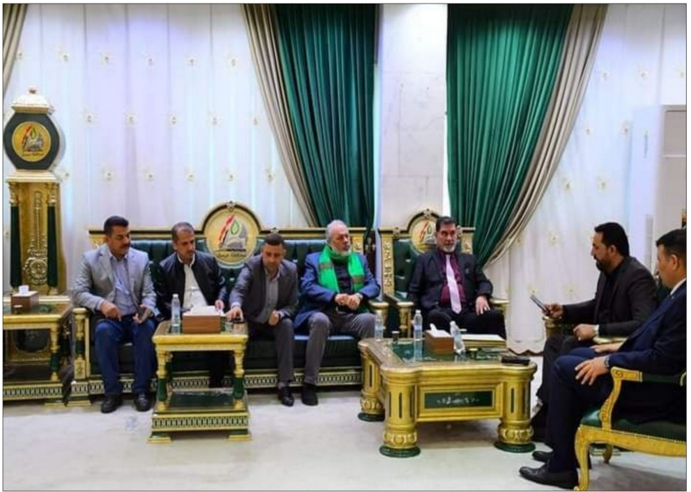
ميسان-كوكبا على الاستاذ ذكر "المكتب الاعلامي لنقود محافظة ميسان: ان وكيل محافظ ميسان الاستاذ جعفر الطبري، امر بتشكيل لجنة لدراسة الحادث الذي وقع في جسر الطبري، في قضاء الكرخة في محافظة ميسان، الذي وقع في ١٥ تشرين الثاني الماضي. وأضاف: ان اللجنة تم تشكيلها باشراف السيد قائم مقام قضاء ميسان-كوكبا على الاستاذ