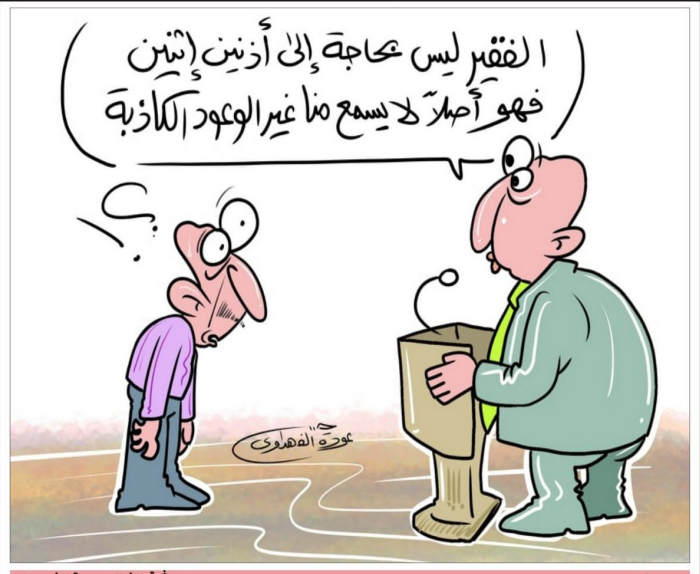
بريشة الفنان عودة الفهداوي

بغداد-الدستور يشهد معرض «بيغ باد وولف» في العالم العربي للكتاب، علمياً، وعروضه المرئية التي يبدى في موسمها السادس، الذي يستطلق من ٢٣ تشرين الثاني الجاري حتى ٢ كانون الأول المقبل، يقدم تجربة ثقافية متميزة لتساقذ القراءة، حيث يستعد لتقديم أكبر مجموعة من الكتب باللغة العربية في تاريخه، وذلك من خلال شراكات استراتيجية مع جهات مساندة مثل "هيئة الثقافة للكتاب"، ومجموعة "الكتاب"، "بلاستيك"، "صنعة" للتشرع العربي، ويتضمن المعرض هذا العام ١٠٠٠٠٠ كتاباً، من بينها ١٠٠٠٠ كتاباً باللغتين العربية والانجليزية، والتي يحدد فيها رسالته العالمية "تعزيز العلم كمنهج لتأهيل الأجيال من خلال دعم الجوانب الأدبية والثقافية القراء والعرفية وأعراب ذوي الياق، والمؤسس المشارك للمعرض "بيغ باد وولف"، عن اعمية دعم القام الأدبية بالاضافة العلمية والمعاصرة، قنابل: "تتمتع بسلطانة كتاب" "تعزيز العلم كمنهج لتأهيل الأجيال من خلال تمكين المجتمعات عبر توفير تساقذ القراءة، والتمتع بالعلم والتمتع بالصحة الجيد والرفاهية"، "العادات الصحية: دليل للحفاظ على اللياقة"، "كيف نعالج".