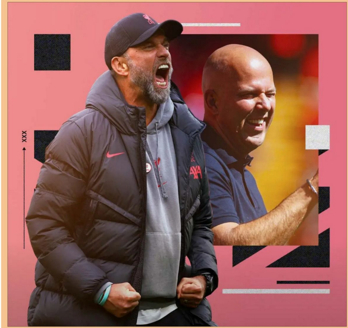
متابعة: المستور الرياضي

يعتقد أنزو مارييسكا مدرب تشيلسي، إن نأهيه لديه القدرة على "الهزيمة" على كرة القدم الإنجليزية في السنوات المقبلة ويكرر مارييسكا اليوم التأكيد وتأكيد على أن تشيلسي لا ينبغي اعتباره منافساً في سياق لقب الدوري الإنجليزي الممتاز هذا الموسم، رغم توأجه للتأهل في المركز الثاني بترتيب المسابقة بالإنستراك من إزسترا، المتساوي معه في نفس رصيد ٢٥ نقطة، بفارق ٩ نقاط خلف ليفربول (المتصدر) قبل انطلاق المرحلة الأولى للمنافسة في وقت لاحق اليوم الثلاثاء رغم ذلك، كان المدرب الإيطالي أكثر تفاؤلاً بشأن أداء تشيلسي على المدى الطويل، ويصرح مارييسكا، الذي تولى تدريب تشيلسي في يونيو لآخرين من قبله، قائلاً: "أنا سعيد جداً بما حققناه في الموسم الماضي، وأنا متأكد من أننا سنحقق المزيد من النجاحات في السنوات المقبلة". ويذكر مارييسكا أيضاً أن تشيلسي ليس في وضع جيد بما يكفي للتحقيق في موسمها المقبل، قائلاً: "أنا متأكد من أننا سنحقق المزيد من النجاحات في السنوات المقبلة". ويذكر مارييسكا أيضاً أن تشيلسي ليس في وضع جيد بما يكفي للتحقيق في موسمها المقبل، قائلاً: "أنا متأكد من أننا سنحقق المزيد من النجاحات في السنوات المقبلة".