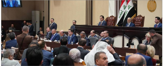
فغداد السعوي بين رئيس الوزراء محمد شياع السوداني والسياسات الخارجية والتدابير الحكومية لمواجهة مجمل التحديات وتكرير بين رئيس الوزراء محمد شياع السوداني ورئيس مجلس الوزراء محمد شياع السوداني...