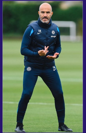
متابعة: المستور الرياضي

يعتقد أنزو مارييسكا مدرب تشيلسي، إن نأهيه لديه القدرة على "الهزيمة" على كرة القدم الإنجليزية في السنوات المقبلة ويكرر مارييسكا اليوم التأكيد وتأكيد على أن تشيلسي لا ينبغي اعتباره منافساً في سياق لقب الدوري الإنجليزي الممتاز هذا الموسم، رغم توأجه للتأهل في المركز الثاني بترتيب المسابقة بالإنستراك من إزسترا، المتساوي معه في نفس رصيد ٢٥ نقطة، بفارق ٩ نقاط خلف ليفربول (المتصدر) قبل انطلاق المرحلة الأولى للمنافسة في وقت لاحق اليوم الثلاثاء رغم ذلك، كان المدرب الإيطالي أكثر تفاؤلاً بشأن أداء تشيلسي على المدى الطويل، ويصرح مارييسكا، الذي تولى تدريب تشيلسي في يونيو لآخرين من قبله، قائلاً: "أنا سعيد جداً بما حققناه في الموسم الماضي، وأنا متأكد من أننا سنحقق المزيد من النجاحات في السنوات المقبلة". ويذكر مارييسكا أيضاً أن تشيلسي ليس في وضع جيد بما يكفي للتحقيق في موسمها المقبل، قائلاً: "أنا متأكد من أننا سنحقق المزيد من النجاحات في السنوات المقبلة". ويذكر مارييسكا أيضاً أن تشيلسي ليس في وضع جيد بما يكفي للتحقيق في موسمها المقبل، قائلاً: "أنا متأكد من أننا سنحقق المزيد من النجاحات في السنوات المقبلة".