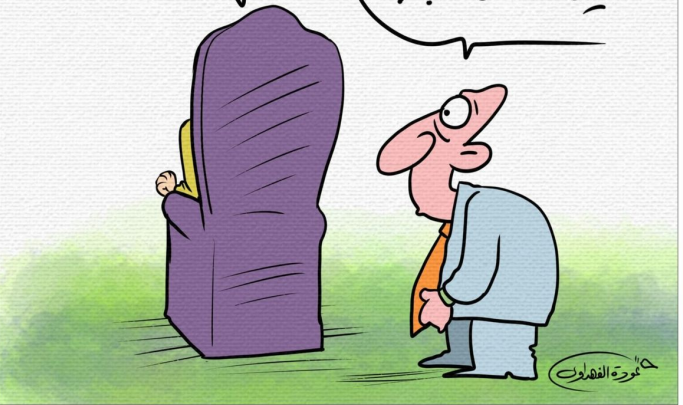
بريشة الفنان عودة الفهداوي كاركاتير

أسأد.. ليس ما كسفت حقيقة القتل؟! حتى يبقى لشعب واحد بينهم الآخر وأحنا مسطرين