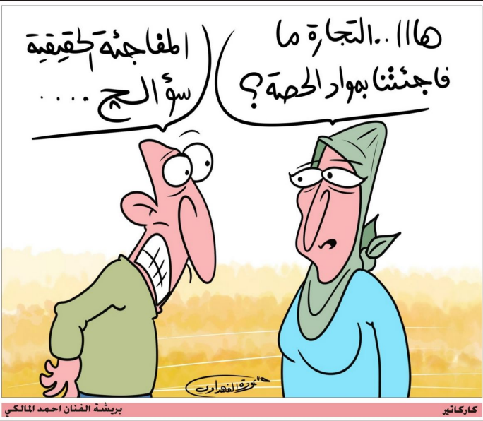
بريضة الفنان احمد المالكي كاركاتير