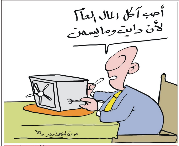
بريشمة الفنان عودة الفهداوي