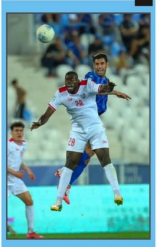
الأردن يلعب العراق لكرة القدم