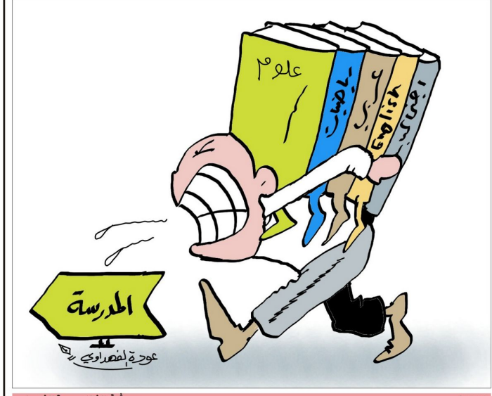
بريشمة الفنان عودة الفهداوي